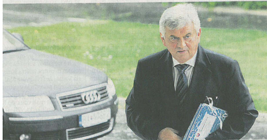
Podľa ministra Ľubomíra Jahnátka po dátume spotreby bývajú najmä potraviny z dovozu, pri ktorých obchodníci nedokážu výrobky vrátiť dodávateľom.

Exemplárnou ukážkou ne- dodržiavania zákona o potra- vinách boli počas leta podvody pri predaji zeleniny. Niektorí vý- robcovia bez váhania označova- li paradajky, papriku či iné dru- hy zeleniny za slovenské, hoci pochádzali z Poľska, Maďarska či z iných krajín. Takto falošne malo byť označených dovedna 15-tisíc ton zeleniny. Inšpektori zastavili predaj tejto zeleniny, nariadili jej likvidáciu a udeľo- vali pokuty od dvetisíc eur vyš- še. © AUTORSKÉ PRÁVA VYHRADENÉ