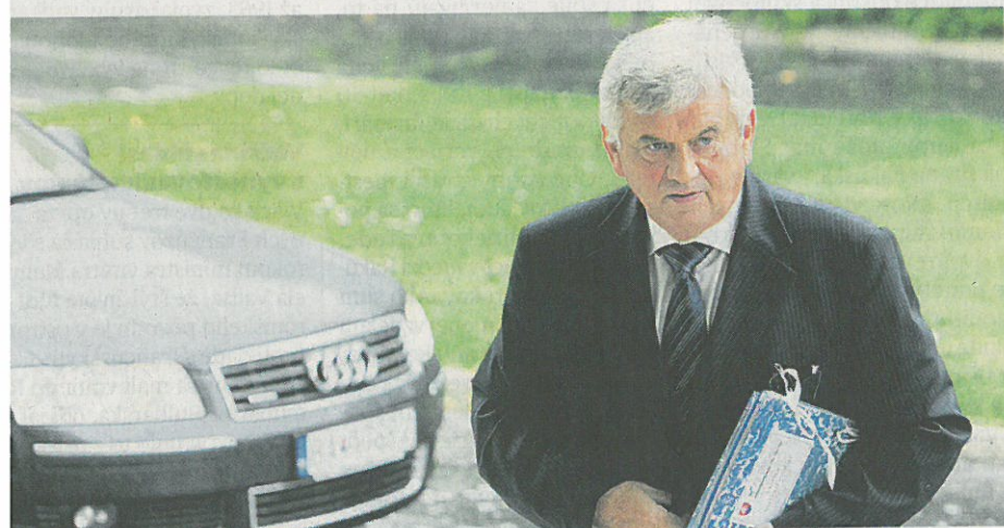
Podľa ministra Ľubomíra Jahnátka po dátume spotreby bývajú najmä potraviny z dovozu, pri ktorých obchodníci nedokážu výrobky vrátiť dodávateľom.

Exemplárnou ukážkou ne- dodržiavania zákona o potra- vinách boli počas leta podvody pri predaji zeleniny. Niektorí vý- robcovia bez váhania označova- li paradajky, papriku či iné dru- hy zeleniny za slovenské, hoci pochádzali z Poľska, Maďarska či z iných krajín. Takto falošne malo byť označených dovedna 15-tisíc ton zeleniny. Inšpektori zastavili predaj tejto zeleniny, nariadili jej likvidáciu a udeľo- vali pokuty od dvetisíc eur vyš- še. © AUTORSKÉ PRÁVA VYHRADENÉ